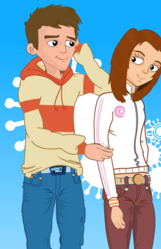
I batteri della clamidia

Esercitare queste capacità costituisce la base sicura per poter trasferire questa competenza nella realtà.